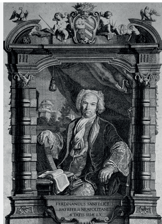
Fig. 2 – Anonimo, Ritratto di Ferdinando Sanfelice all'età di 60 anni.

Palazzo Sanfelice fu realizzato presumibilmente tra il 1724 e il 1728, ma alcuni autori ipotizzano un arco temporale più ampio. Le notizie storiche sulla vita e l'opera dell'architetto, e le vicende urbanistiche dell'area Vergini-Sanità in cui visse e operò, non sono oggetto di questo studio se non per brevi accenni, funzionali agli argomenti trattati. Nella bibliografia e nelle note sono indicati i testi di autorevoli autori che costituiscono un ampio e documentato riferimento scientifico su questi temi e ad essi si rimanda per approfondimenti e ulteriori informazioni. Nell'itinerario critico sono stati selezionati alcuni brani significativi che delineano in sintesi alcuni tratti essenziali della personalità del Sanfelice, con acute riflessioni sul suo palazzo e sulle famose scale aperte.